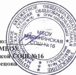
График работы учителя - логопеда